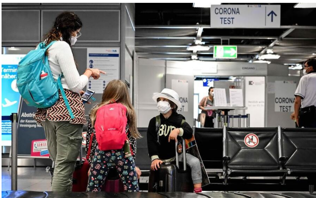
Immagine simbolo

I dati Cna: dimezzati i posti disponibili sugli aerei, mentre i costi per famiglia per arrivare in Sardegna salgono in media a 930 euro