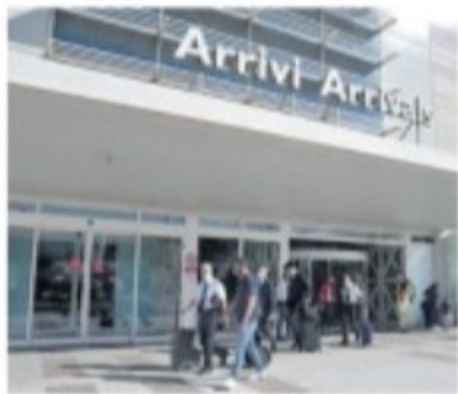
Arrivi all'aeroporto di Olbia

Effetto Covid: l'offerta aerea per l'isola si dimezza, con un calo del 50% tra posti e voli. Nonostante dai primi di luglio sia possibile spostarsi tra i Paesi europei per turismo o affari, la domanda internazionale è destinata a rimanere stagnante per tutto il periodo estivo. Lo rileva un report della Cna, secondo il quale nell'isola l'effetto della crisi sono una riduzione del 36% del numero di combinazioni possibili per raggiungere la regione e un aumento medio delle tariffe: Il costo medio per un viaggio in Sardegna (andata e ritorno per una famiglia tipo di quattro persone) aumenta di circa 100 euro